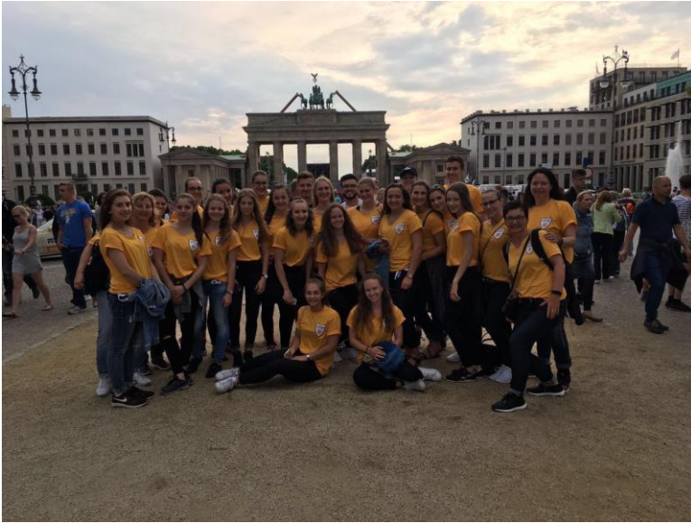
Teilnehmerinnen und Teilnehmer des GSV Erdmannhausen sowie KSV Hoheneck vor dem Brandenburger Tor.

Das Gelände der Messe Berlin war Turnfestzentrum und Dreh- und Angelpunkt der vielen Turnfest-Aktivitäten. Hier fanden sämtliche Wettkämpfe, Vorfürungen sowie die Turnfest-Akademie mit Workshops und Fortbildungen statt. Am Abend war die Messe Veranstaltungsort für die Tuju-Party, den Länderabend sowie die Abschlussparty. Viele Aussteller waren vor Ort und präsentierten innovative Sportgeräte, Sportbekleidung und präventive Maßnahmen für Vereinsmitglieder. Alle Teilnehmer konnten während der Turnfesttage das vielfältige Angebot in Anspruch nehmen und "Neues" ausprobieren.