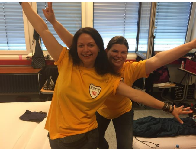
Ausgelassene Stimmung beim Einzug ins Quartier.

Am Samstag, den 3. Juni 2017, ging es für die meisten Teilnehmer bereits sehr früh los. Die einen machten sich um 4:45 Uhr mit dem Bus in Richtung Berlin auf, die anderen kurze Zeit später mit der Bahn. Nach der Ankunft in Berlin bezogen wir das Oberstufenzentrum für Informations- und Medizintechnik in Neukölln, welches für die nächsten vier bis sieben Tage unser "Zuhause" war. Bevor wir jedoch in unser Klassenzimmer gelangten, mussten jedes Mal 96 (!) Treppenstufen überwunden werden. Somit war das tägliche Sportprogramm gesichert.